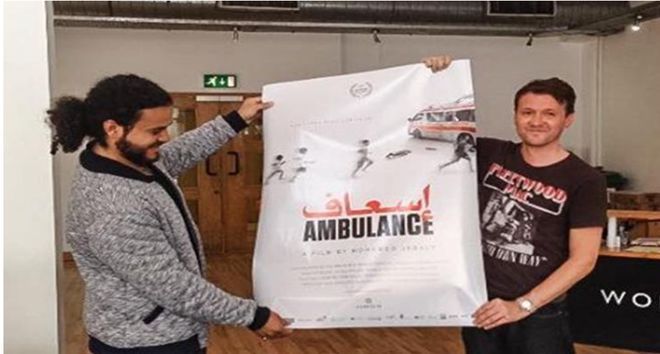
Mohamed med filmlakaten