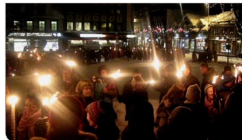
Demonstrasjon i Tromsø under krigen i Gaza i januar 2009.

Mange har vært engasjert; først og fremst et stort antall aktivister både i Gaza og Tromsø. Engasjementet til kjente fagfolk