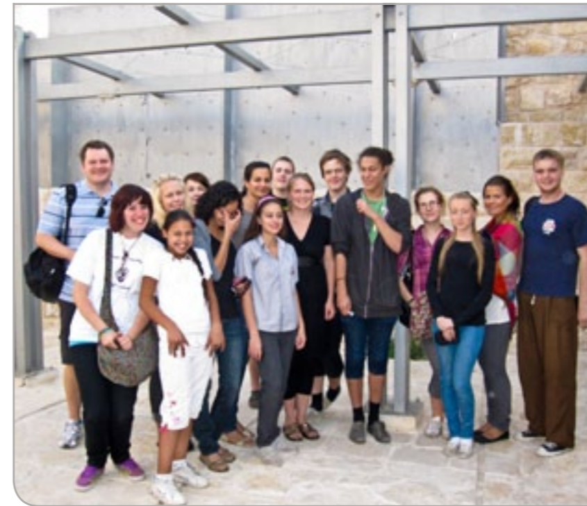
Palestinakomiteens ungdomsgruppe i Tromsø på tur i Palestina.

en egen demokratisk stat slik de andre arabiske landene nå utvikler seg til. Da kan palestinerne fritt fiske i Middelhavet, og samarbeidet om fisk utvikler seg mellom våre to byer. Da reiser vi like gjerne til Gaza på badeferie og filmfestival, som palestinerne kommer hit på nordlyssafari eller konferanser. Mulighetene er uante. Kanskje kan vi komme i en situasjon der vi behøver vennskapet like mye som de trenger vårt nå. Palestinerne glemmer aldri hvem som er deres virkelige venner. 🌊