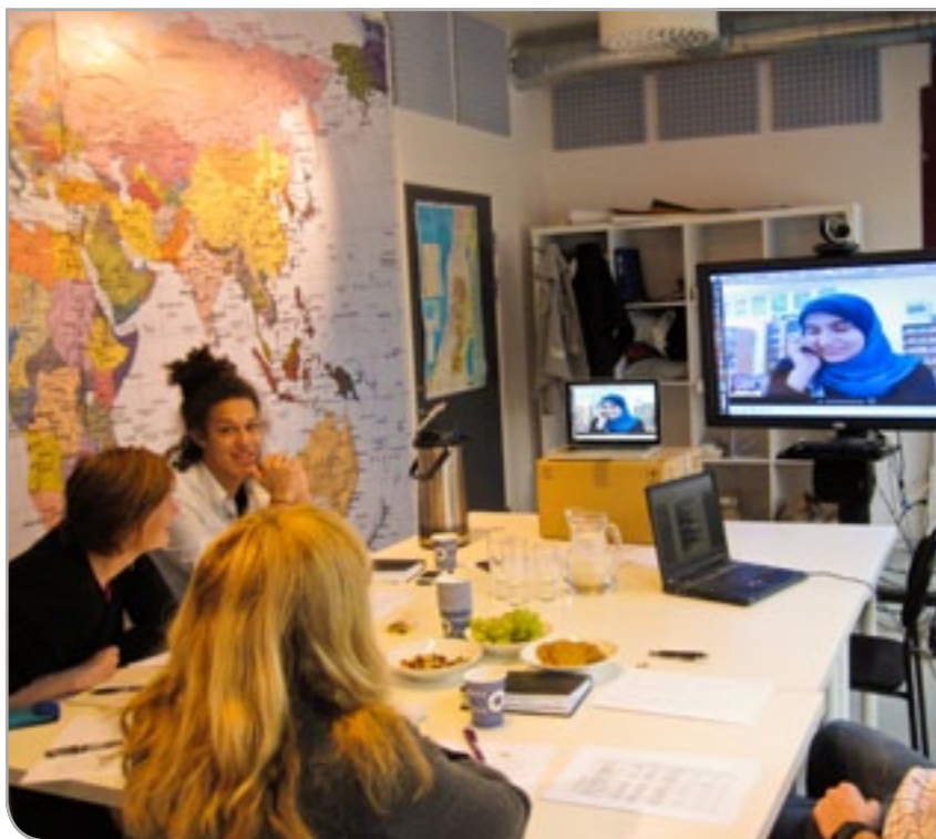
Videokonferanse mellom Tromsø og Gaza.

ungdomsfilmsenter og videokonferansesenter i Gaza, har jobbet med idrettsaktiviteter og animasjonsfilm, og har bredt sitt