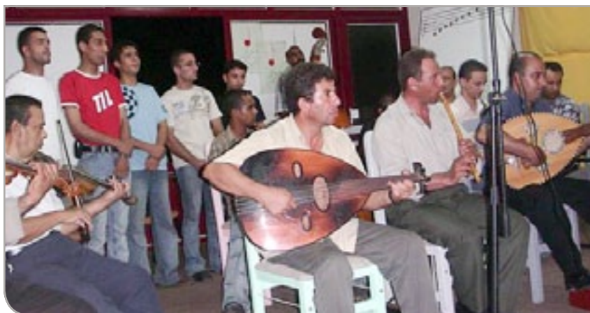
Representanter fra Tromsø besøkte Gaza i 2006.