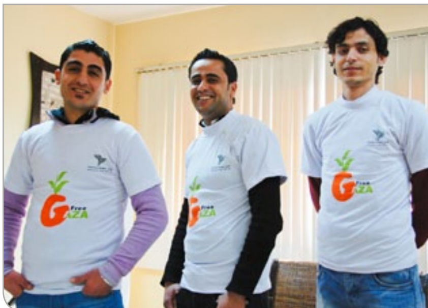
Tre av våre venner i Gaza med nye Vennskap Tromsø-Gaza-t-skjorter

med under NUFF. Det ble laget kortfilmer, og ungdommene fra Gaza hadde også med seg film fra hjembyen sin. Hvert år siden har NUFF hatt kontakt i Gaza, men det har blitt stadig vanskeligere å få til besøk. Når ikke folk fra Gaza kan komme til NUFF kommer NUFF til dem; de siste årene har det vært arrangert parallelle workshops i Gaza som har vært delt med festivalen i Tromsø på internett. 2006 var også året for lansering av vennsgruppas nettside tromso-gaza.no .